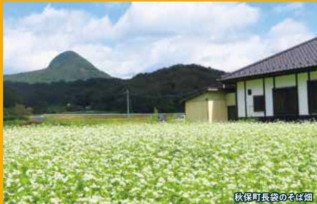
秋保町長袋のそば畑