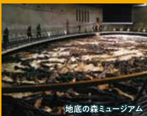
地底の森ミュージアム