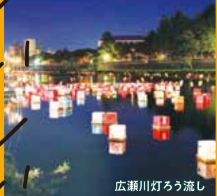
広瀬川灯ろう流し